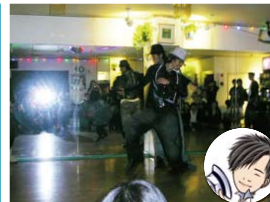
AKB48のダンス指導をしているミッキー先生